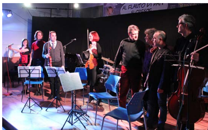
UN MOMENTO DEL CONCERTO DELLO SCORSO ANNO

Il tradizionale concerto di Natale BiblioPan si svolgerà Domenica 22 dicembre alle ore 16,30 . Anche quest'anno l'appuntamento si baserà sul gradito e ormai collaudato intreccio tra musica e lettura. In questa edizione gli interventi musicali, curati dagli insegnanti de Il Flauto di Pan , saranno organizzati all'interno del racconto La creazione di Moeyert ed Erlbruch. Il finale del concerto presenterà come sempre suggestioni musicali legate al Natale e qualche bella sorpresa. Durante il pomeriggio verrà anche presentata la terza edizione di Break concerto : rassegna di appuntamenti nei quali la musica viene raccontata, fatta ascoltare e spiegata dai musicisti.