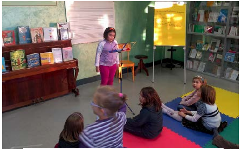
IL GRUPPO LEGGIMI FORTE BAMBINI 1

Da quest'anno il progetto si avvarrà anche del contributo delle diverse figure professionali che animano Scarabocchio , il gruppo di ricerca e sperimentazione in fatto di didattica creato da un anno all'interno della Fondazione. Gli incontri del gruppo adulti saranno aperti ad un pubblico di uditori. Per informazioni, è possibile rivolgersi al personale della Biblioteca in orario di apertura, oppure scrivere una e-mail a biblioteca@bibliopan.it o telefonare allo 0119279509.